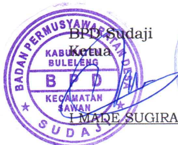
I MADE SUGIRA